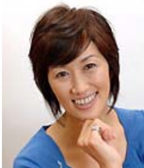
パテックス フェルピナク 35 の CMIに出演されています。 HPでCMが見られますよ！